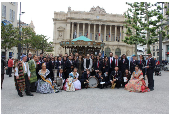
Foto con el cónsul general del Reino de España en Marsella (Francia). Mayo 2019.

Junto a esto, las Sociedades Musicales también han sido incluidas bajo la marca Mediterranean Musix, puesta en marcha por la Turisme Comunitat Valenciana para la promoción de las actividades musicales en la Comunitat, hecho que se ha visto reforzado por su reconocimiento como Bien de Interés Cultural Inmaterial (BIC).